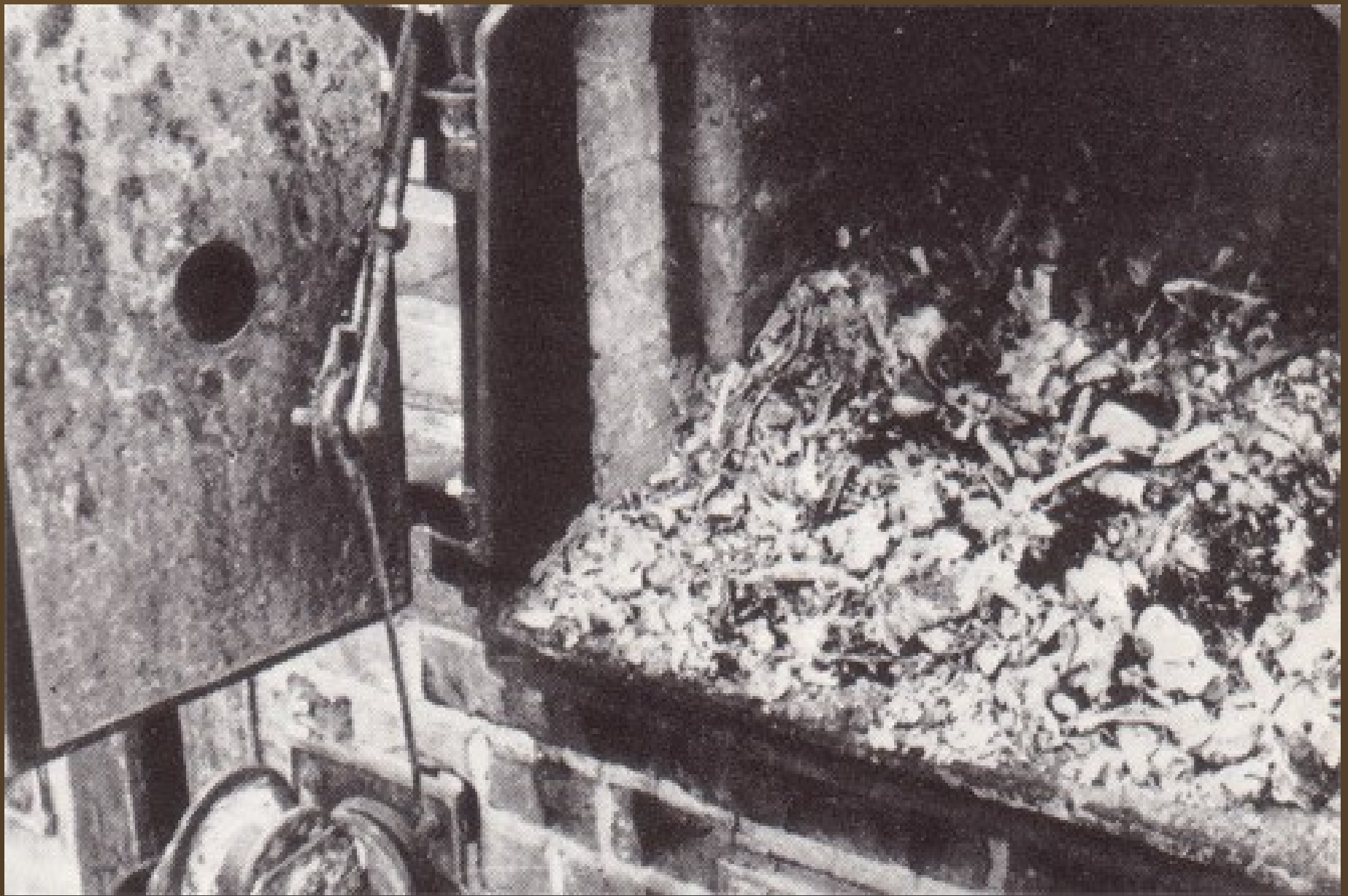
Крематорий был сложен из кирпича высокой огнеупорности.