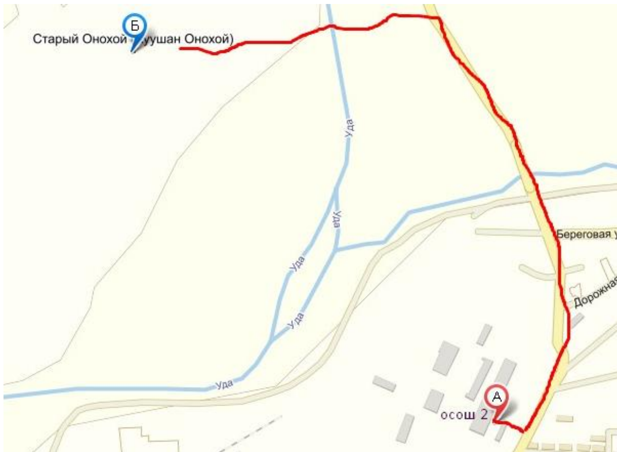
Схема маршрута Онохой – Онохой-2 (общий вид на картографической основе)